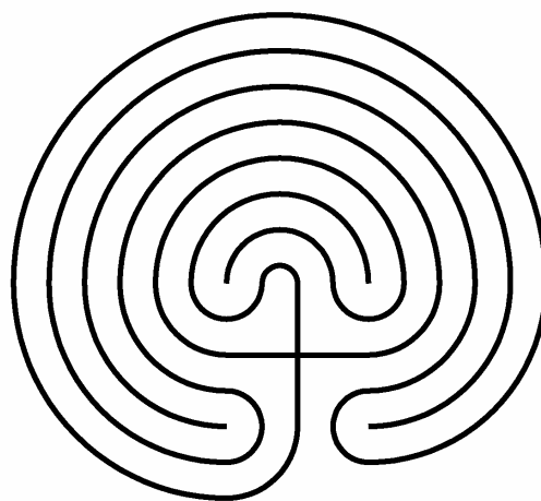
El laberinto clásico o cretense es la forma primigenia del laberinto.

simbólico sobre la reclusión y la libertad, la vida y la muerte, el mundo subterráneo y la salvación.